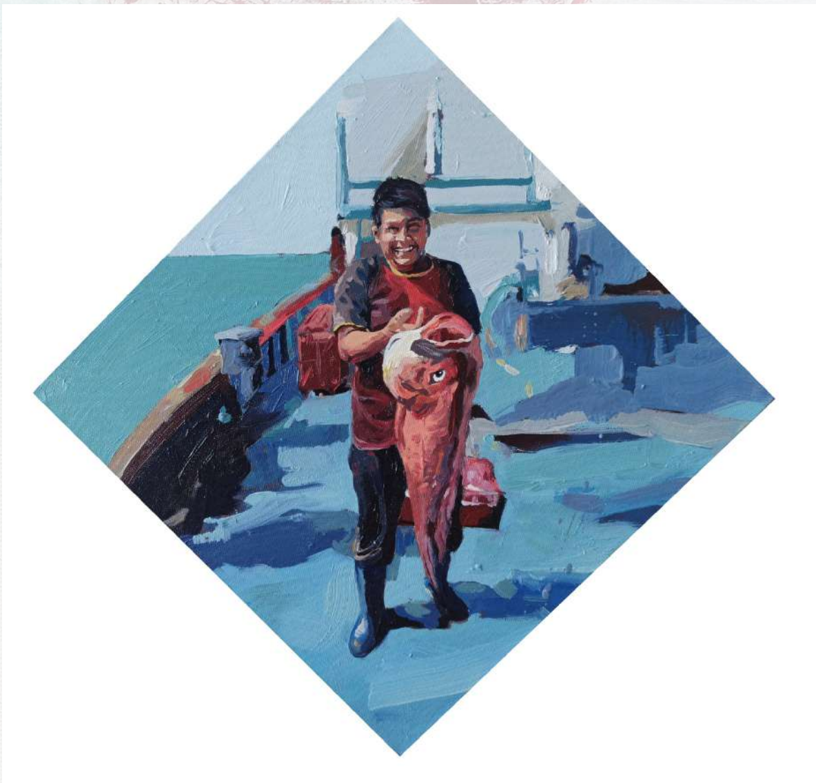
PESCA DEL CONGRIO ROJO