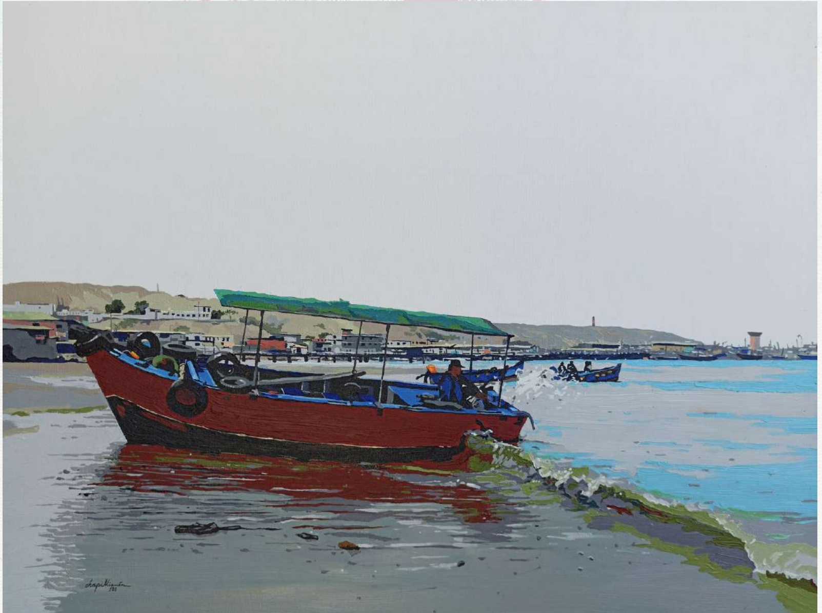
A ORILLAS DEL TORIL