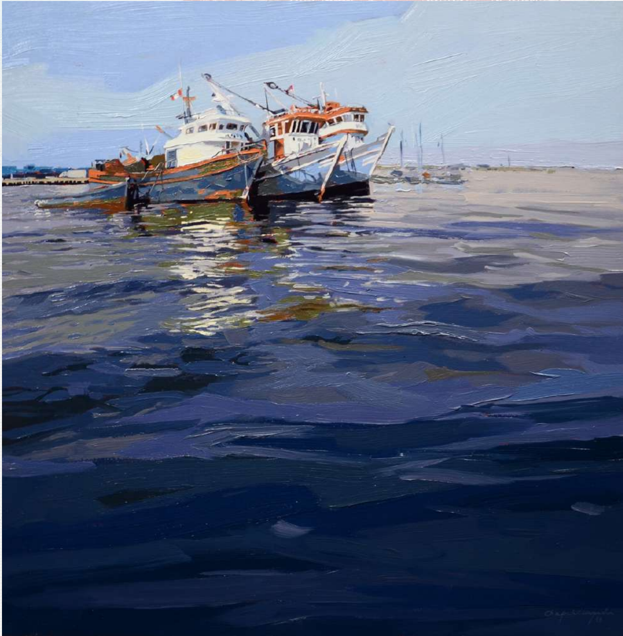
TU BRISA ME ACUNA Óleo/ lienzo, 80 x 80 cm.