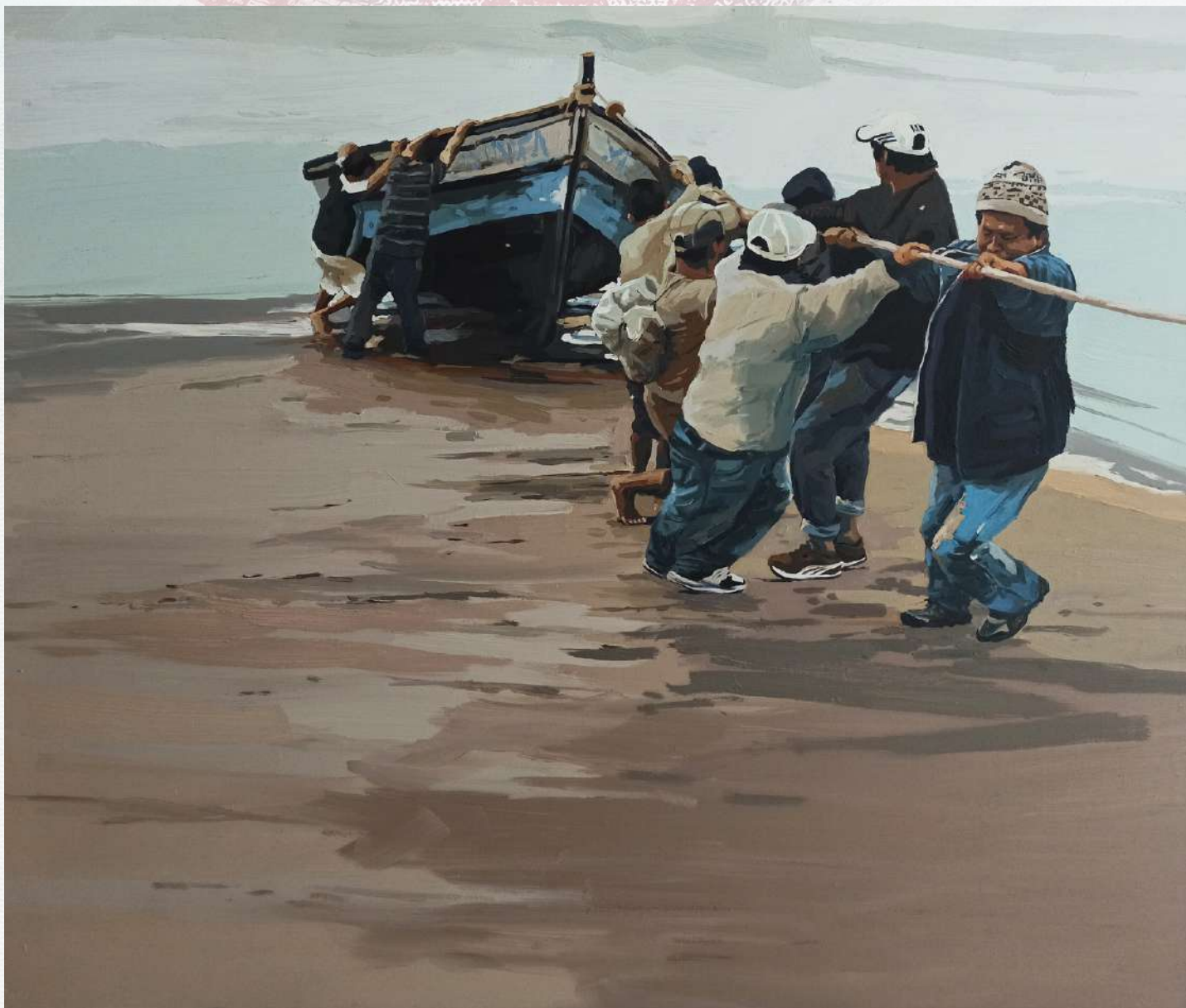
VARANDO EMBALARCACIÓN ARTESANAL