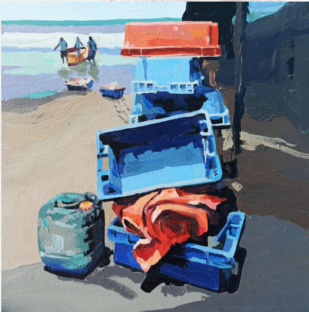
CUBETAS DE PESCA