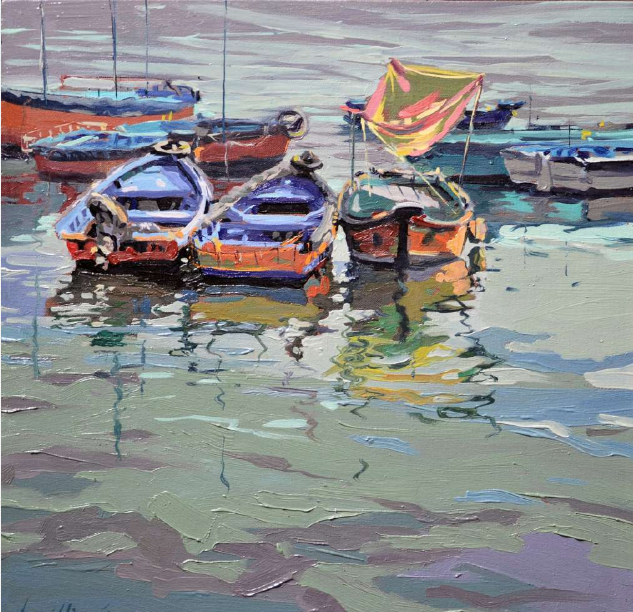
CHALANAS EN PUERTO DE PAITA