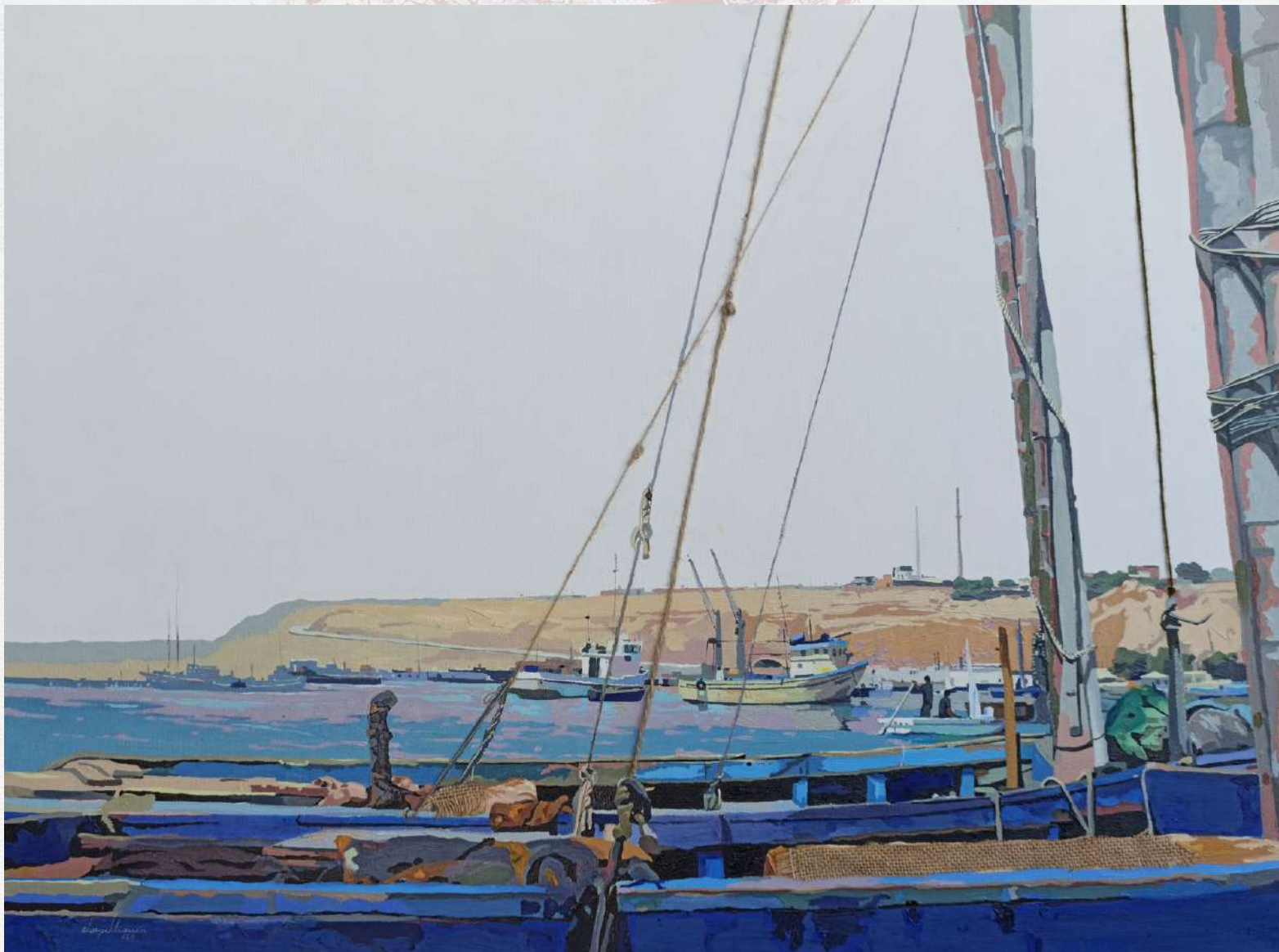
ENTRE CUERDAS Y MÁSTILES