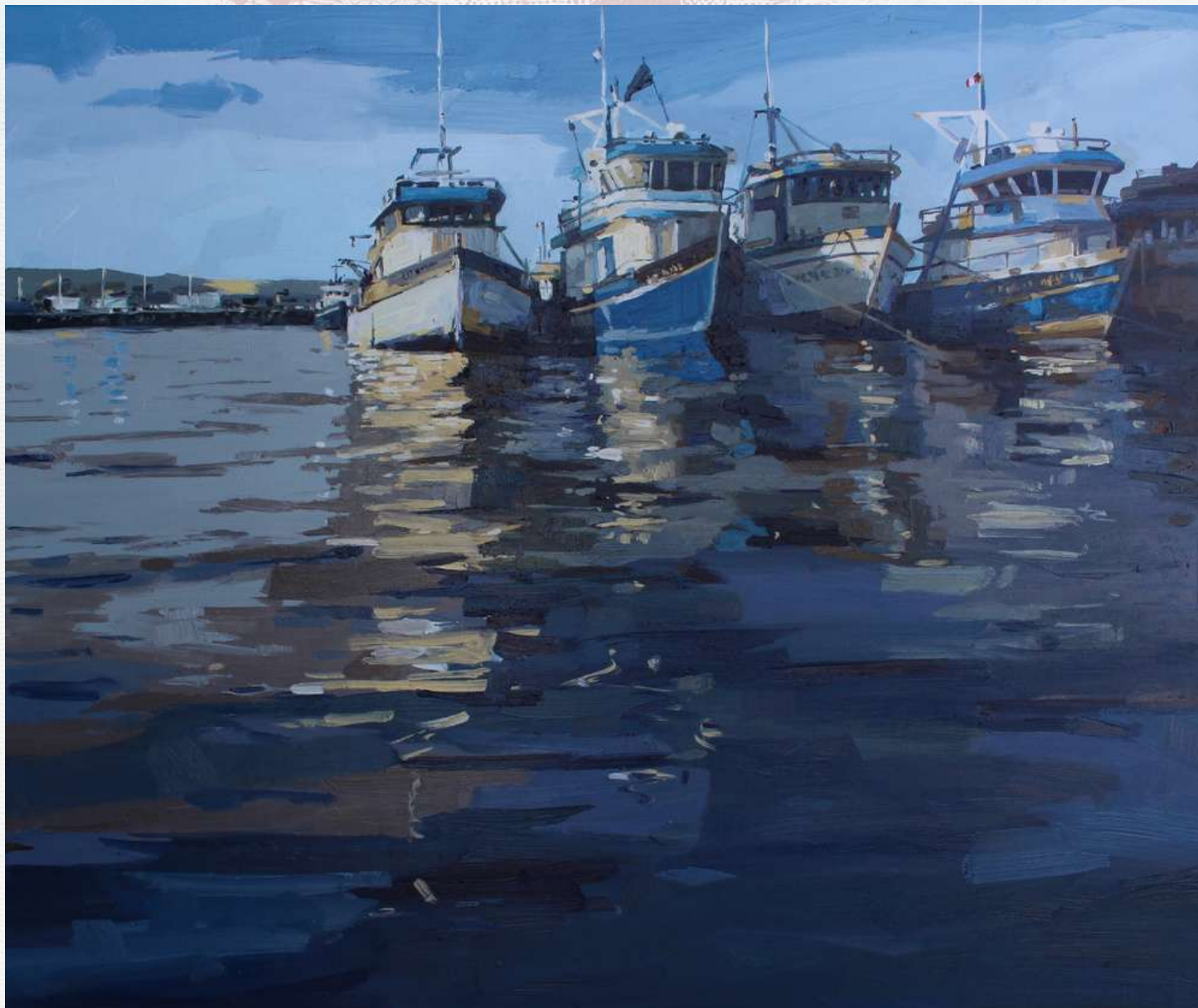
COTIDIANIDAD DE UN PUERTO