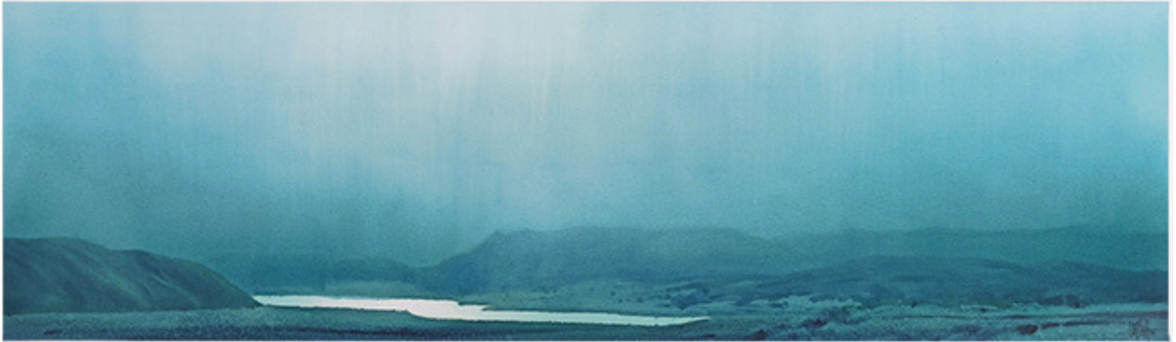
MIISTERIOS E ILUSIONES-LAGUNA DE HUAYPO