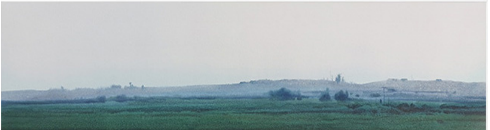
CON EL AGRICULTOR