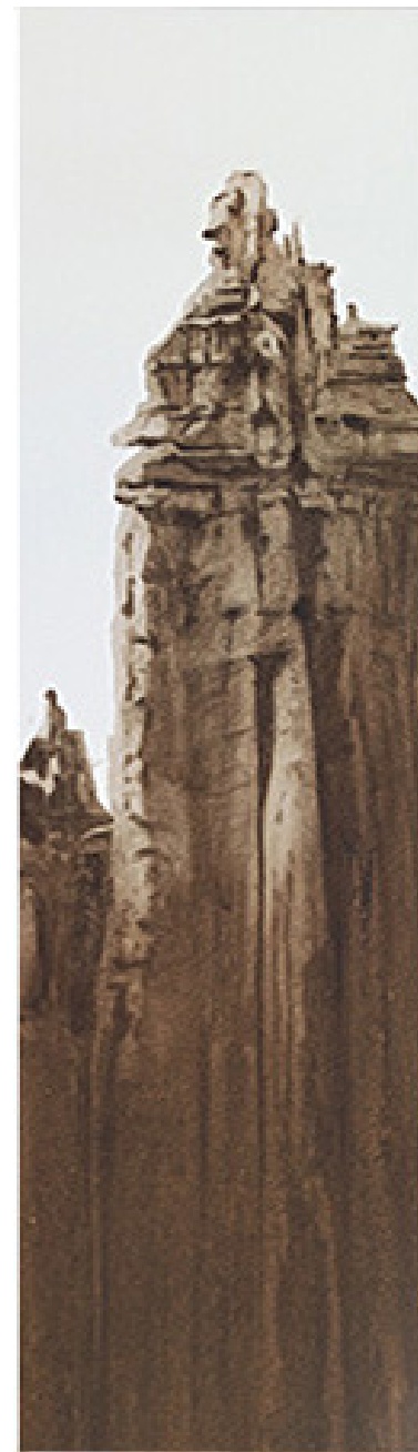
GUARDIÁN DE MACUSANI II