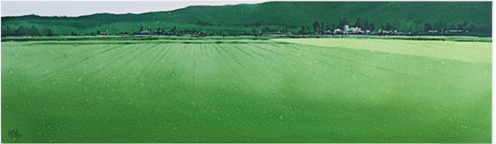
VALLE DE HUAYPO