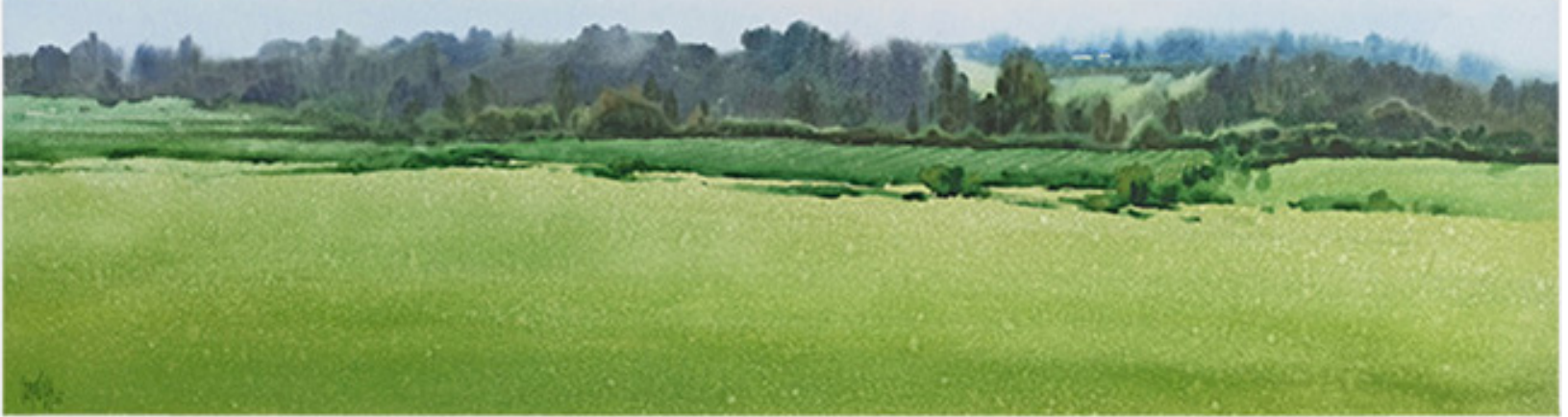
ENTRE ,OLLES Y EUCALIPTOS