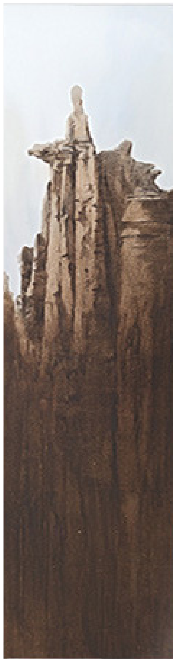
GUARDIÁN DE MACUSANI