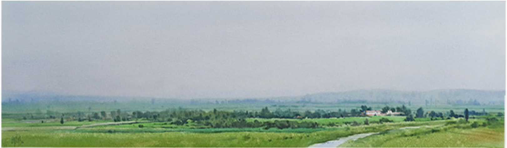
VALLE DE MOCHE