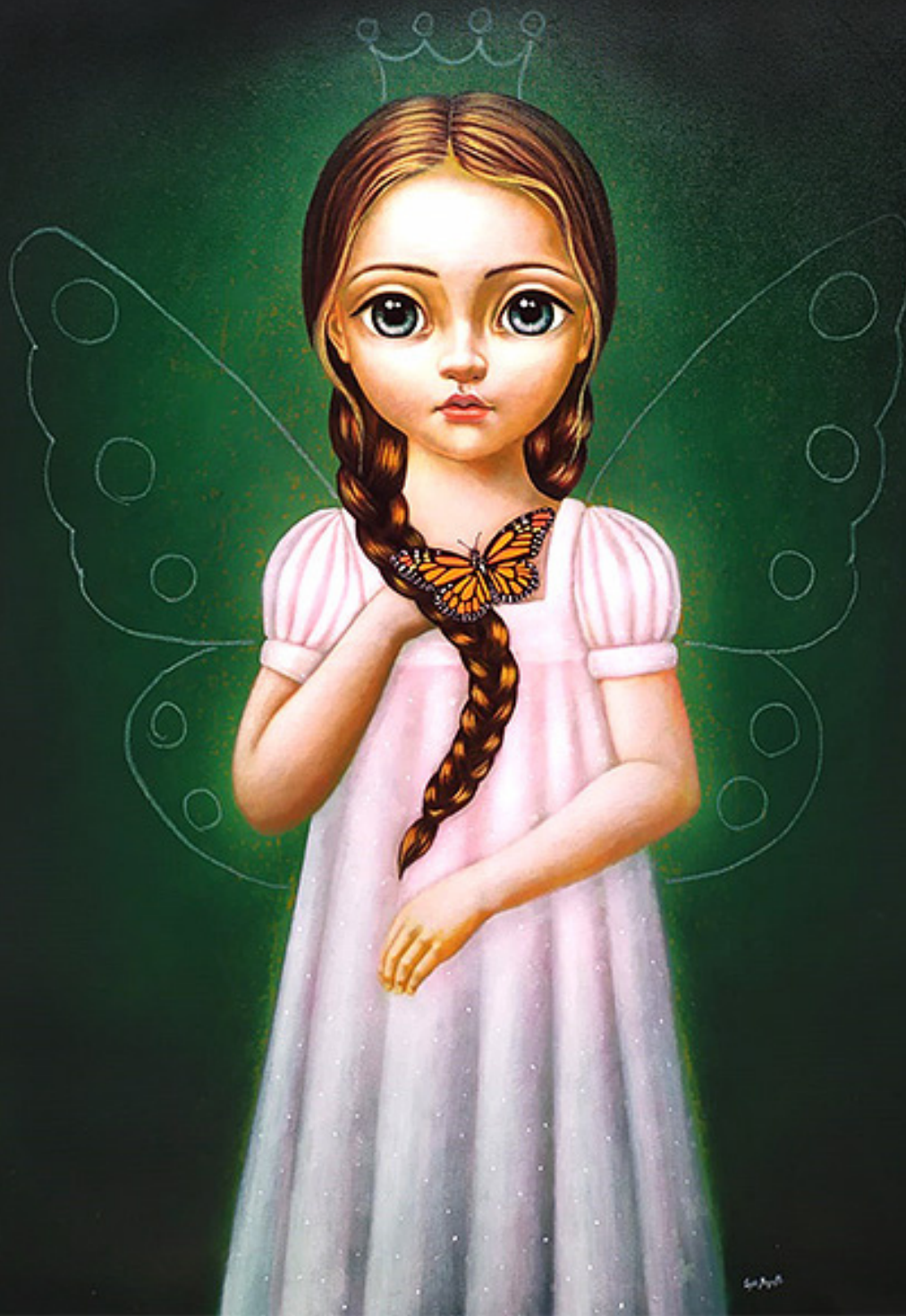
METAMORFOSIS MÁGICA Óleo sobre lienzo / 120 x 100 cm