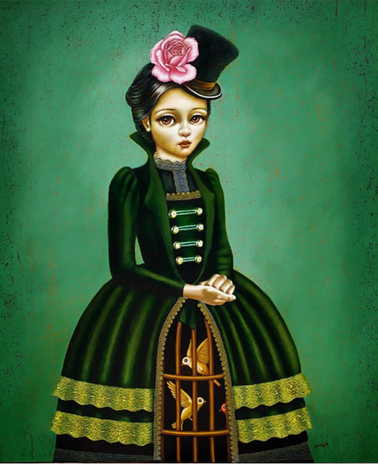
LIBERTADORA Mixta / 120 x 100 cm