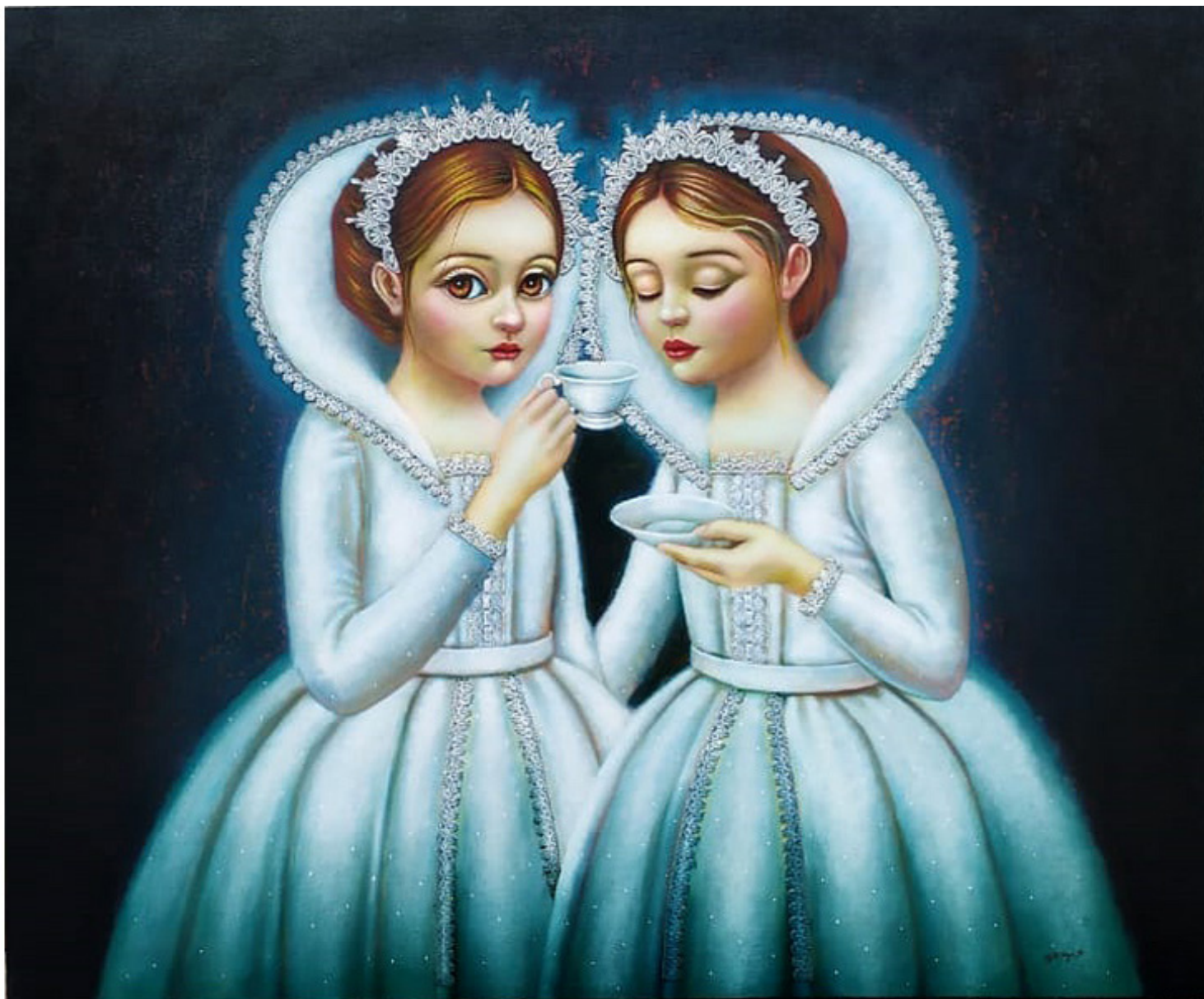
HORA DEL TÉ Mixta / 100 x 120 cm