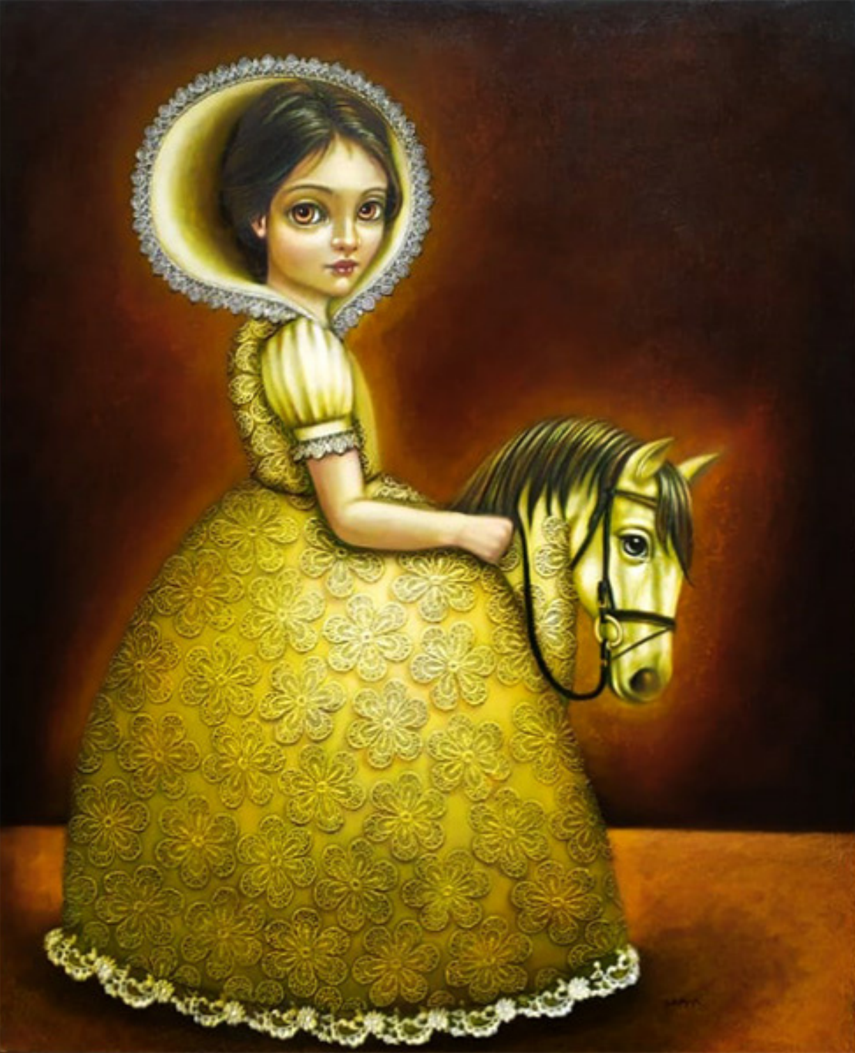
CABALGANDO MIS SUEÑOS Mixta / 120 x 100 cm